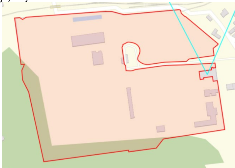
Situační plán mikrovlnných (MW) spojů

Zhotovitel stavby respektovat veškeré požadavky předepsané ve vyjádřeních, rozhodnutích a podmínkách závazných stanovisek dotčených orgánů.